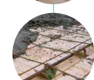
Fasi di posa del Sistema SINTEC®